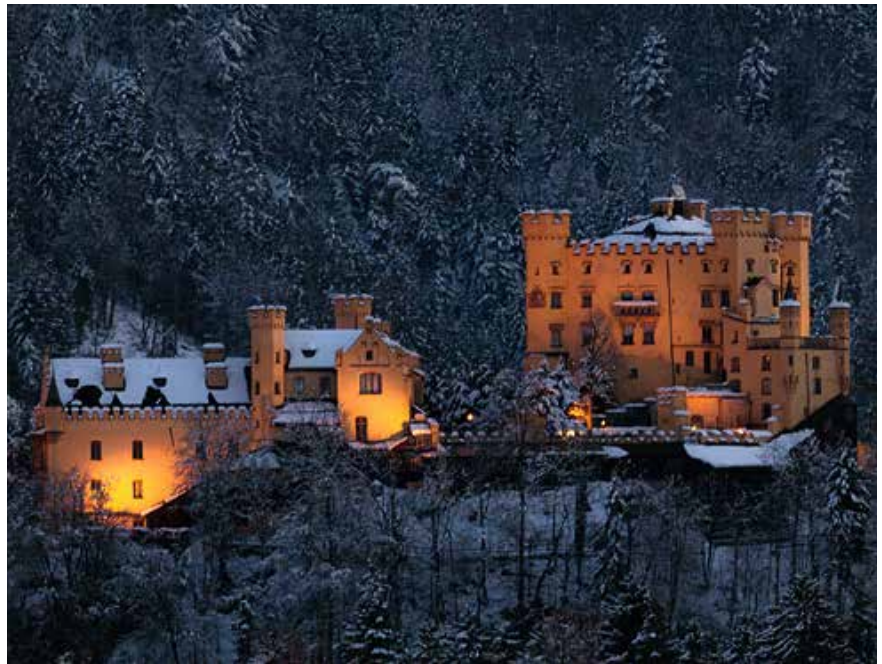
König Ludwig II. verbrachte viele Weihnachtsfeste auf Schloss Hohenschwangau

Behaglich leuchten die Fenster der alten Burg auf dem alles über- blickenden Hügel, den Heimweg nach Hohenschwangau. Die ehe- malige Behausung der Ritter von Schwangau, die so vielen seiner Ahnherren ein Zuhause war, bis sie im Laufe der Zeit verfiel. König Ma- ximilian II., Ludwigs Vater, ließ sie im „neuen deutschen Styl“ ausbauen und machte sie zur Jagd- und Som- merresidenz seiner Familie. Lang ist's her, dass große Feste und bun- tes Treiben die Burg belebten. Seit König Maximilians II. Tod gibt es