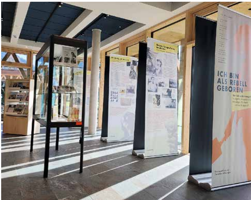
Die Ausstellung zu Ilse Schneider-Lengyel im Loungebereich der neuen Tourist Information

SCHWANGAU UND DIE POESIE. EIN ABEND FÜR ILSE SCHNEIDER-LENGYEL