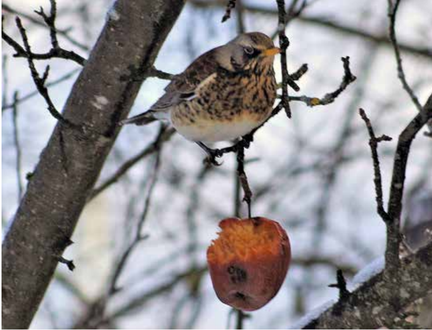
Die heimische Singdrossel im Winter

Benötigen unsere Vögel im Winter zusätzliches Futter, um zu überleben oder schadet es ihnen? Unser Gebietsbetreuer Tom Hennemann beleuchtet dieses häufig kontrovers diskutierte Thema und gibt Tipps zum richtigen Verhalten im Winter.