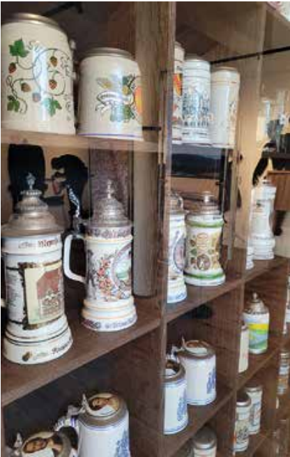
Die Sammlung unterschiedlicher Bierkrüge sollte man sich nicht entgehen lassen

Für die Herstellung der unterschiedlichen Biere im Schlossbrauhaus nach dem Reinheitsgebot von 1516 braucht es Wasser, Malz, Hopfen und Hefe. Als regionales Produkt haben alle Sorten einen unverwechselbaren Geschmack, der den Bieren eine besondere Individualität verleiht.