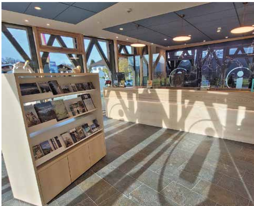
Der Beratungsraum der neuen Tourist Information

„Jahrelang hat der Gemeinderat nach einem neuen Standort für die Tourist Information gesucht und hat jetzt die optimale Lösung gefunden,“ freut sich Bürgermeister Stefan Rinke. Das Schlossbrauhaus bietet eine moderne Infrastruktur für die Besucher. Dazu gehören beste Lage, kostenlose Parkplätze, starkes Bayern W-Lan, öffentliche Toiletten und ein attraktiver Aufenthaltsbereich. Die Umsetzung des kommunalen Projekts wurde durch die öffentliche Förderung RE-ACT-EU Bayern sehr unterstützt.