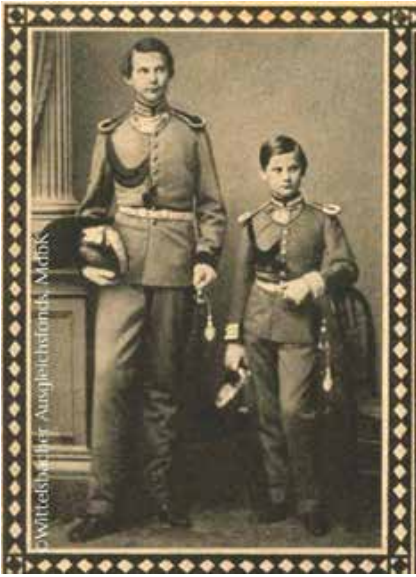
König Ludwig II., hier noch als Kronprinz, mit seinem jüngeren Bruder Prinz Otto

König Ludwig II. war wohl vieles. Träumer, Visionär, Märchenheld, Frauenschwarm, Wagner Mäzen und natürlich Erbauer der Königsschlösser. Aber einen gab es, für den war er weniger und so viel mehr. König Ludwig II. war nämlich auch noch etwas anderes. Ein großer Bruder. Bester Freund, Spielkamerad, größter Held und liebster Feind. Der Kronprinz, ein Vorbild, immer „der Erste“. Für seinen drei Jahre jüngeren Bruder, den späteren König Otto I., sicher nicht immer leicht.