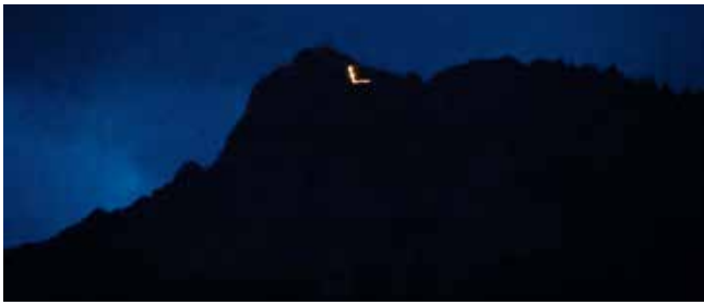
Bergfeuer zum Geburtstag | Anlässlich des 178. Geburtstags von König Ludwig II. wurde das traditionelle Bergfeuer am Tegelberg entzündet. Das L steht für den Anfangsbuchstaben des Namens des Königs.