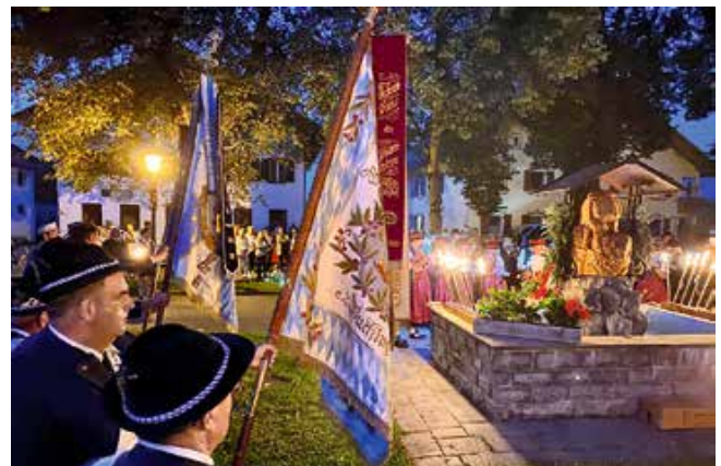
Veteranenjahrtag | Die Veteranen- und Soldatenkameradschaft Schwangau e.V. gedachte am Veteranenjahrtag der in den Kriegen gefallenen Söhne Schwangaus. Der Tag klang mit dem traditionellen Kameradschaftsabend aus.