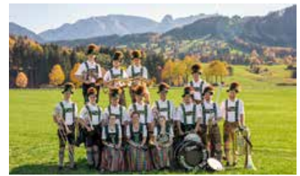
Musikkapelle Alpenguß aus Buching