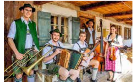
Brotzeitmusi aus Schwangau

Herbst ist Oktoberfestzeit! Denn die Ursprünge der Wiesn, wie das traditionelle Münchener Oktoberfest genannt wird, finden sich im 19. Jahrhundert. Prinzregent Ludwig von Bayern (später König Ludwig I.) heiratete Prinzessin Therese von Sachsen-Hildburghausen am 12. Oktober 1810. Fünf Tage später feierte man das freudige Ereignis anders als es bisher üblich war, nämlich mit einem Pferderennen. Dieses fand auf der später nach der Braut benannten Theresienwiese in München statt.